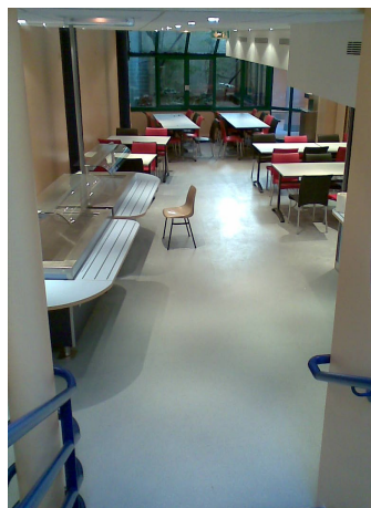
Entrée du self-service