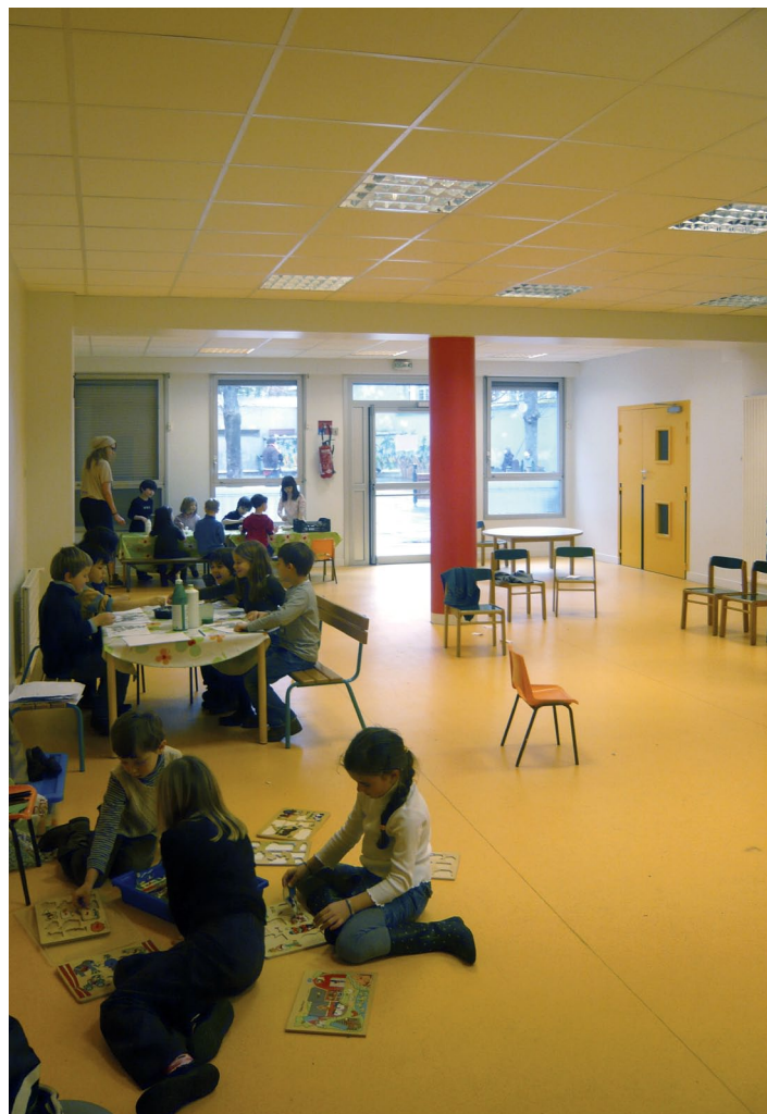
Salle pour cours de primaire