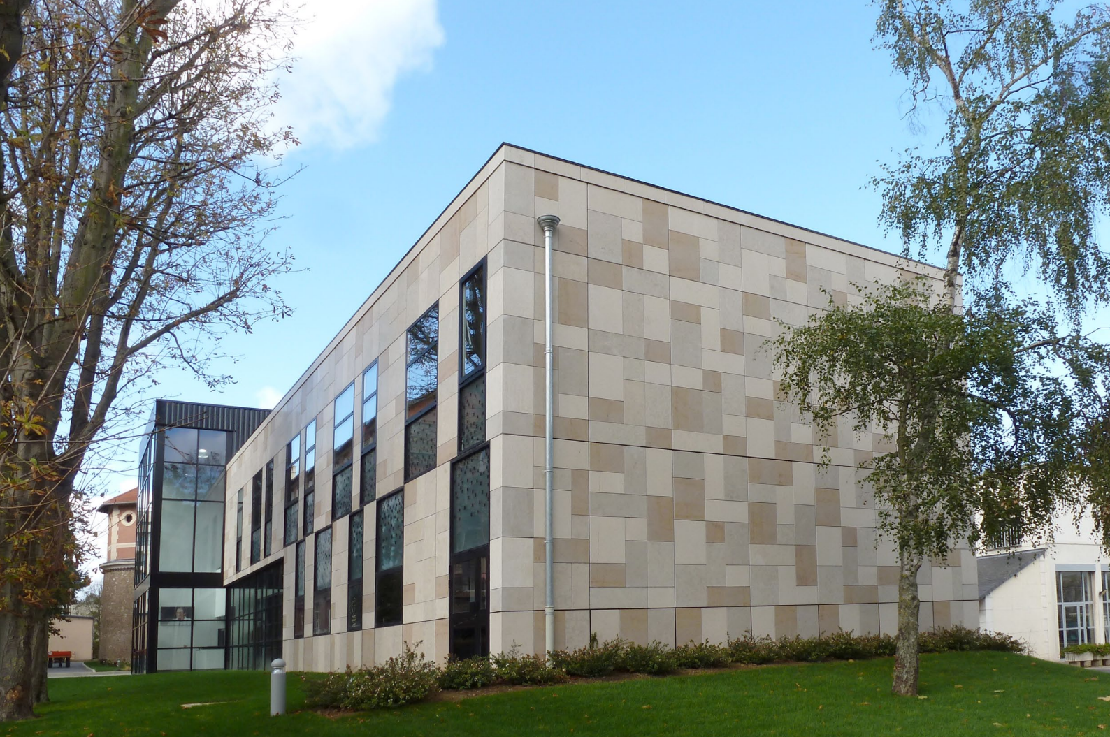
Vue générale du bâtiment Pierre Ceyrac