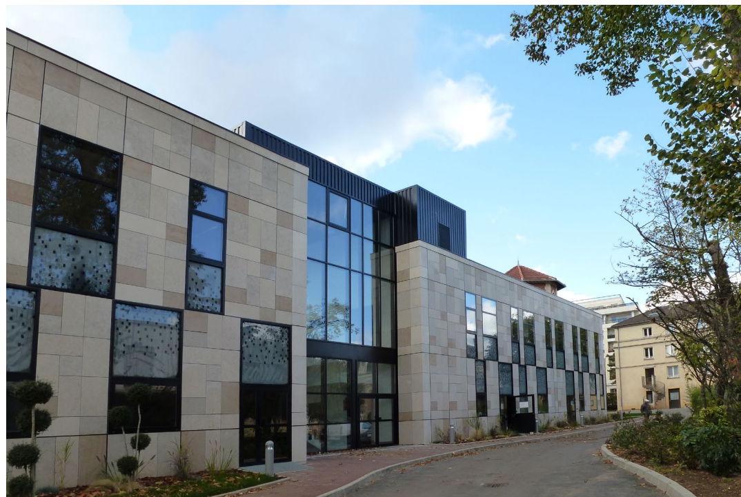
Entrée du bâtiment